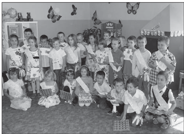
Předškoláci z Křesťanské mateřské školy, kteří se slavnostně rozloučili se školou.